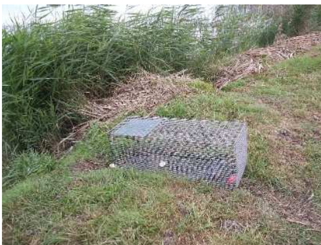
Cage-piège sélective pour ragondins et rats musqués

Votre commune participe à la limitation du développement des rongeurs aquatiques nuisibles (Ragondins/Rats Musqués) et donc à réduire fortement le risque de contraction de la Leptospirose